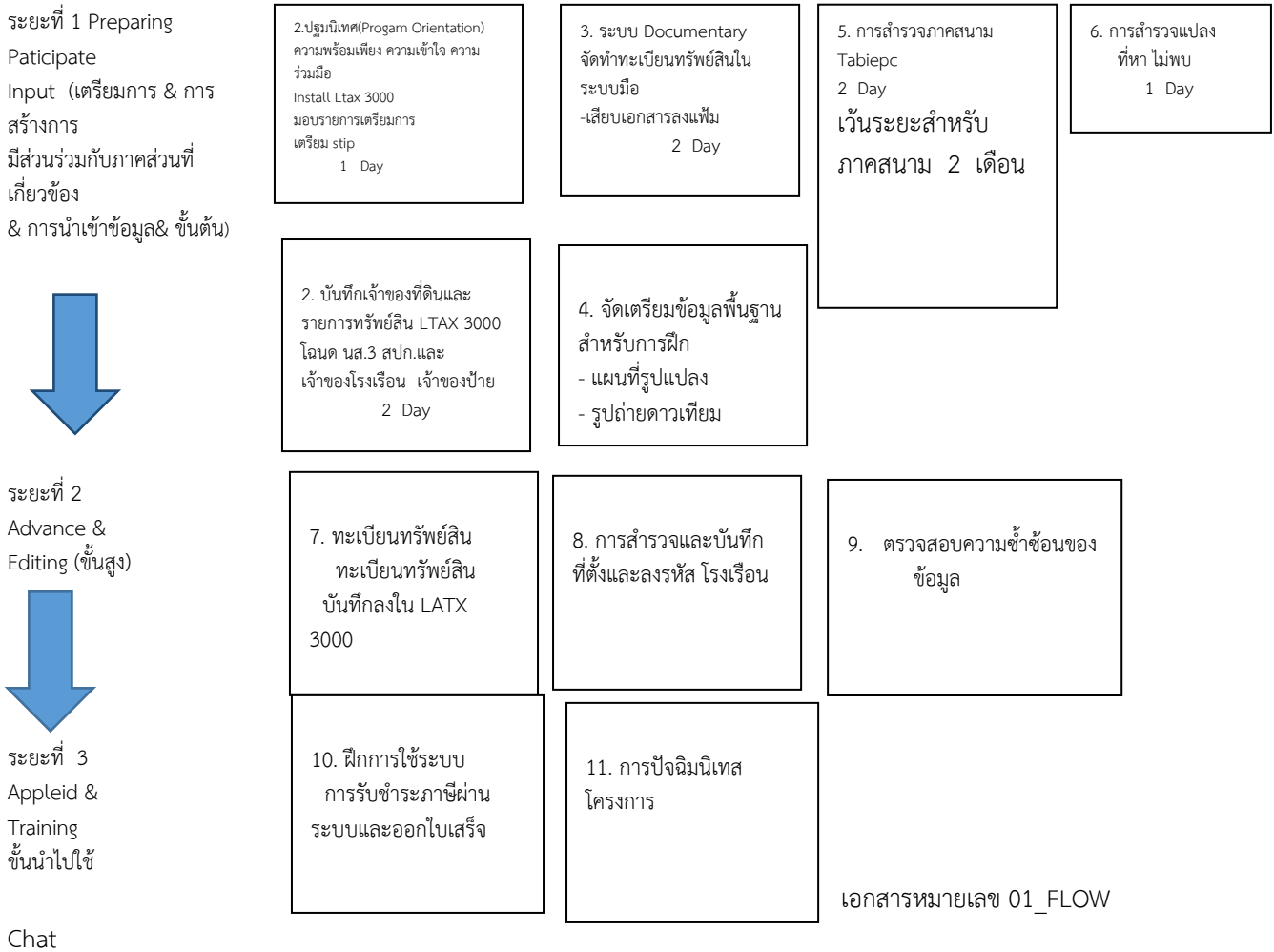
แบบแผนการฝึกระยะต่างๆ จำนวน 18 วัน

ระยะเวลาดำเนินการโครงการ 1 ปีโดยกำหนดแผนผังและรายละเอียดการดำเนินโครงการตามรูปและตารางประกอบ